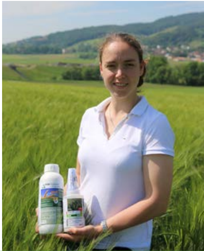
Gesichter des Maschinenrings

Wer den Pflanzenschutz komplett auslagern will ist bei unseren Dienstleistern an der richtigen Adresse. Sie erledigen für unsere Landwirte auf Wunsch die komplette Spritzung. Der Landwirt selbst gibt hierfür seine Vollmacht und der Dienstleister kümmert sich um den Pflanzenschutzmittel-Einkauf, die Anwendungsbestimmung und die richtige Applikation. Bei gewünschter Durchführung bitte ca. 2 Wochen vorher die Kultur, Fläche und Schadfaktor im Büro bekannt geben.